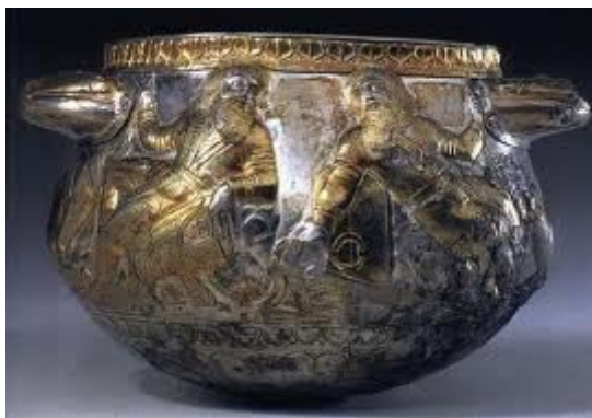
образец скифской посуды

Весьма вероятно, и на этом сосуде, как на Матвеевской вазе, были запечатлены не только памятные эпизоды истории взаимоотношений двух племен, но и события из жизни вождя, погребение которого мы раскопали. Только греческий торевт, изготовивший электрический сосуд, изобразил не конкретных, вполне определенных вождей, а явно идеальных, попутно придав им некоторые совершенно очевидные черты героев родного ему эллинского эпоса. Так что искать портретное сходство между покойным вождем и изображенным на вазе было безнадежным занятием. Причем идеализировал изображенных на сосуде вождей художник вовсе не случайно: сосуд имел несомненно культовое назначение. Возможно, он был специально заказан, чтобы ознаменовать такое торжественное и важное событие, как заключение дружественного союза между двумя племенами.