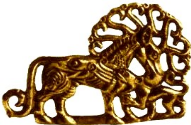
конский налобник с переплетением змей

Изображение змееногой богини мы обнаружили и на овальных щитках, подвешенных на цепочках к массивным золотым серьгам, которые носила жена вождя, погребенная вместе с ним под курганом. Судя по тому, как хорошо они сохранились, надевала она их, видимо, нечасто, лишь по самым торжественным случаям.