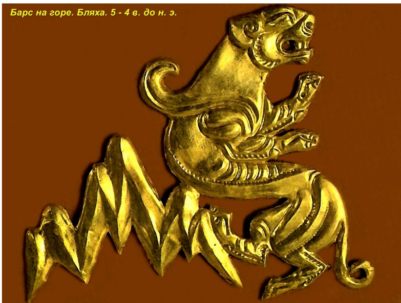
образец звериного стиля

Кочевые скифские племена все время странствовали с места на место. Бродячим домом скифа была кибитка. Мраморных статуй в ней не поставишь, войлочные стены не украсишь мозаикой или фресками. Искусство скифов соответствовало возможностям их быта. Главным образом это были украшения — изображения всяких зверей на оружии, щитах, походном снаряжении, на золотых бляхах конской сбруи и удилах. Эти произведения искусства сопровождали скифа в его вечных скитаниях. Ими легко можно было в любой момент полюбоваться у вечернего костра или во время пира, а потом спрятать в седельные сумки — и ехать дальше или ринуться в бой.